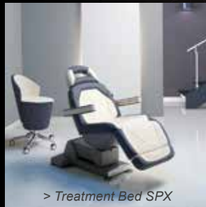
> Treatment Bed SPX