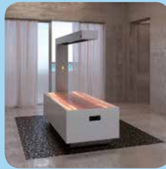
Libra Edge K