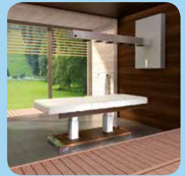
MLR Wet and V-Box

The Gharieni HydroSpa Collection is the ultimate equipment for your water treatments. High-quality Corian® surfaces, shower choreographies and perfect functionality meet state of the art design that enhance the status of luxury spas around the world.