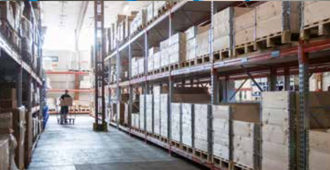
NEW ADDRESS PRODUCTION HALL: Gharieni Group GmbH Am Schürmannshütt 24, 47441 Moers, Germany