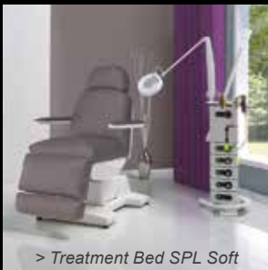
> Treatment Bed SPL Soft