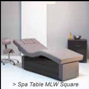
> Spa Table MLW Square