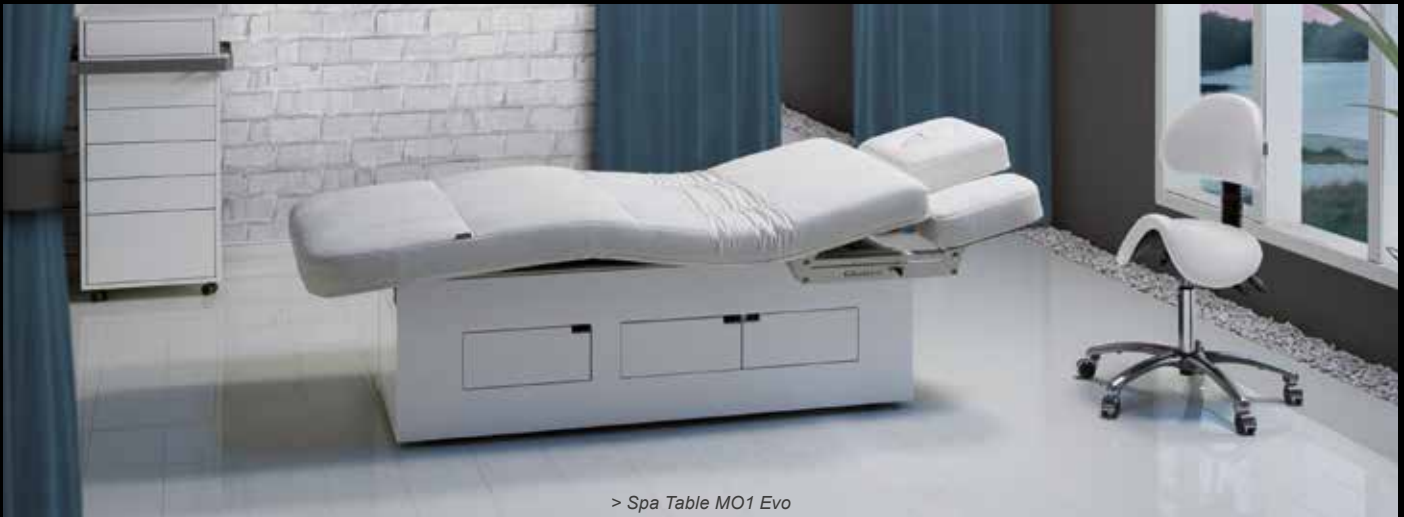
> Spa Table MO1 Evo