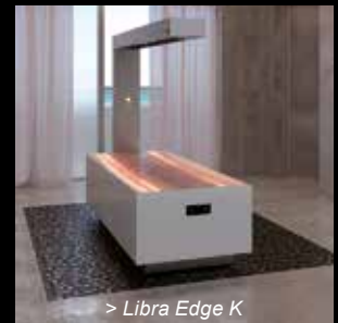
> Libra Edge K