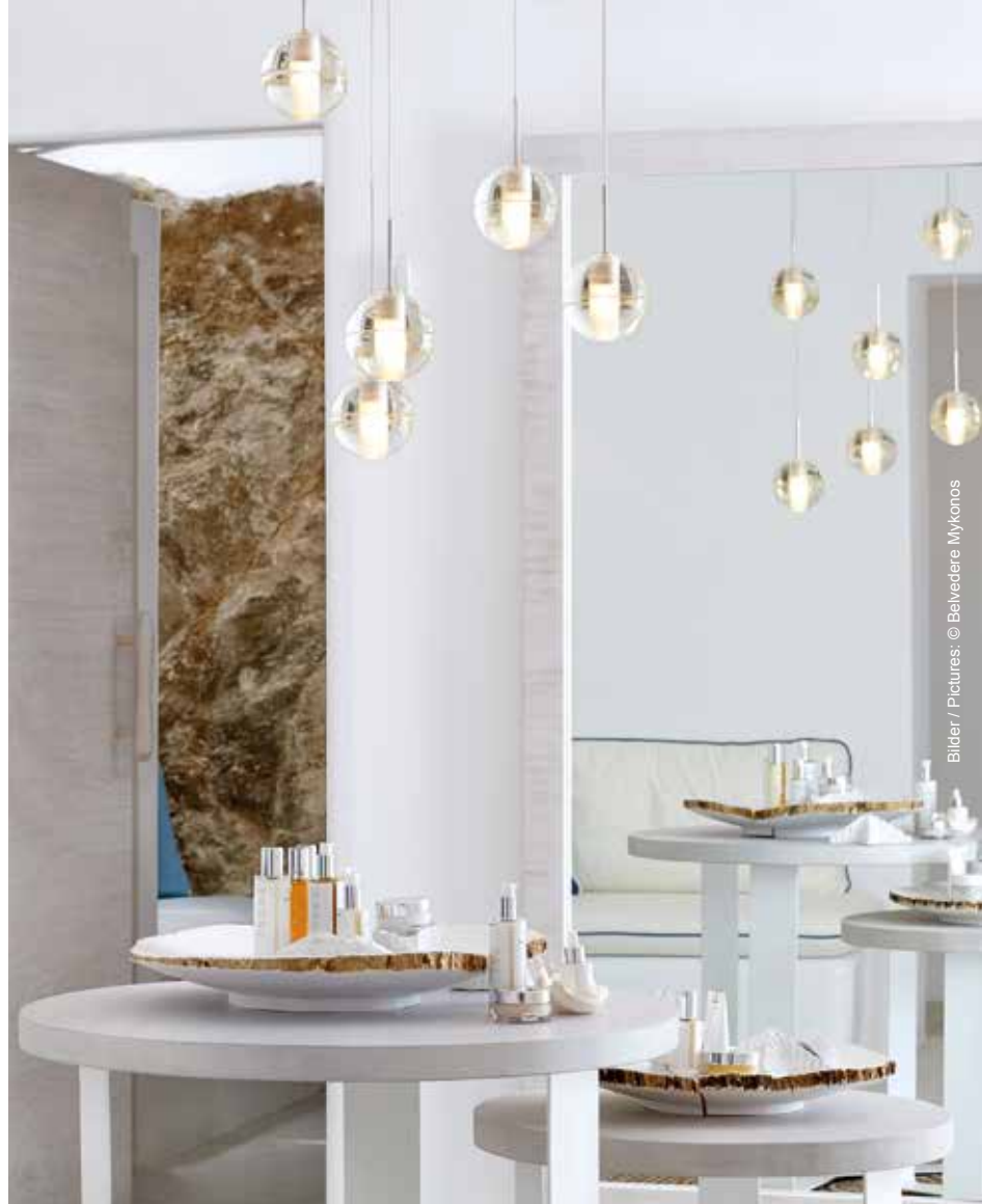
Six Senses Spa im Belvedere Hotel in Mykonos www.belvederehotel.com/six-senses-mykonos

Eine harmonische Verbindung von Moderne und Tradition spiegelt sich im neuen Six Senses Spa im renommierten Belvedere Hotel wider. So findet man im gesamten Spa lokal inspirierte Details wie weiß getünchte Wände und Böden aus Marmor von der Nachbarinsel Naxos. Holz, natürliche Stoffe und viel Licht unterstreichen den luftigen Charakter. Die drei Behandlungsräume, jeweils mit Gharieni-Liegen ausgestattet, verfügen über Dampfduschen und Ruhebetten. Bei den Gesichts- und Körpertreatments setzt man auf die Produkte von The Organic Pharmacy.