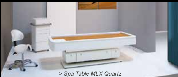
> Spa Table MLX Quartz