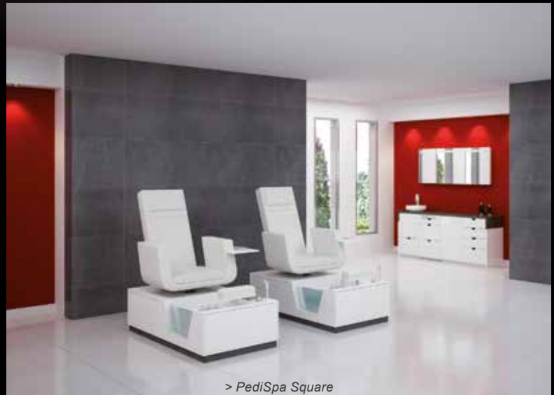
> PediSpa Square